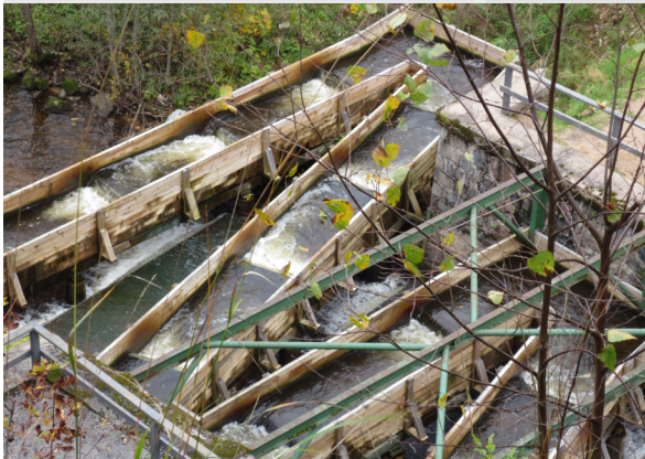
Zivju ceļš Līgatnē