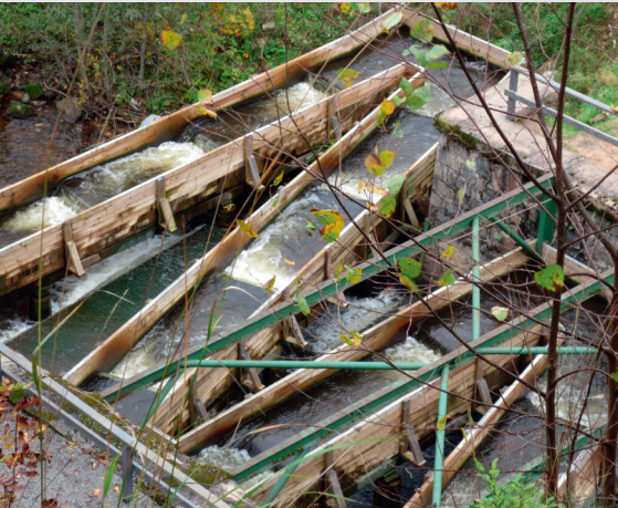
Zivju ceļš Līgatnē