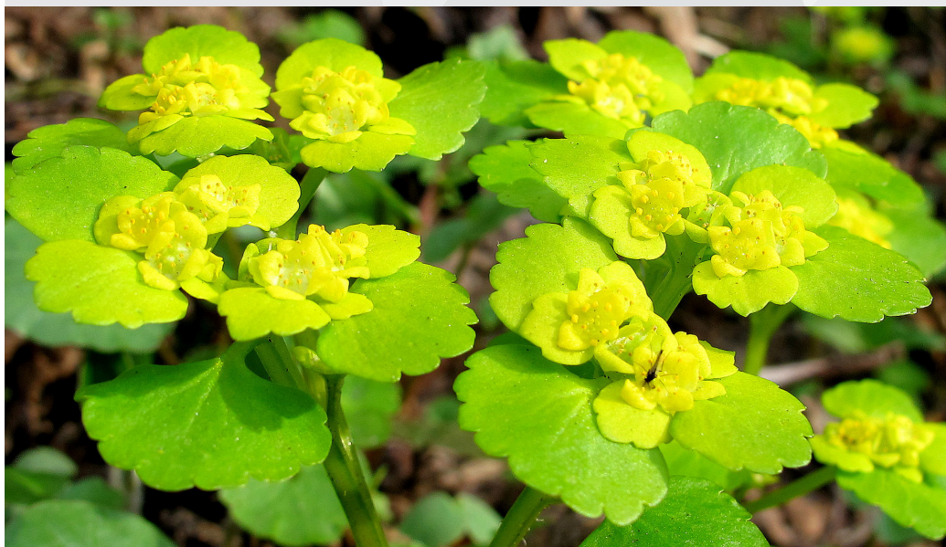
Pamišlapu pakrēslīte ( Chrysosplenium alternifolium )