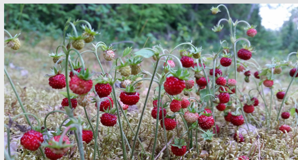
Meža zemenītes ( Fragaria vesca )