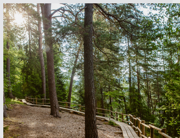
Taka Gaujas Nacionālajā parkā

Dziļa grava ar mazu strautiņu, kas pāršķel Gaujas senlejas kreiso pamatkrastu. Tās dienvidu daļā izveidotas kāpnes, pa kurām var nokļūt līdz Siguldas pludmalei .