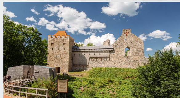
Livonijas ordeņa Siguldas pils