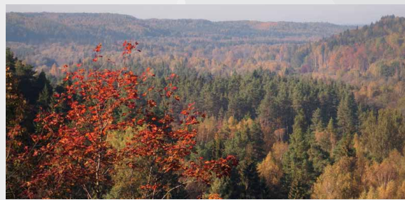
Skats no Paradīzes (Gleznotāju kalns)