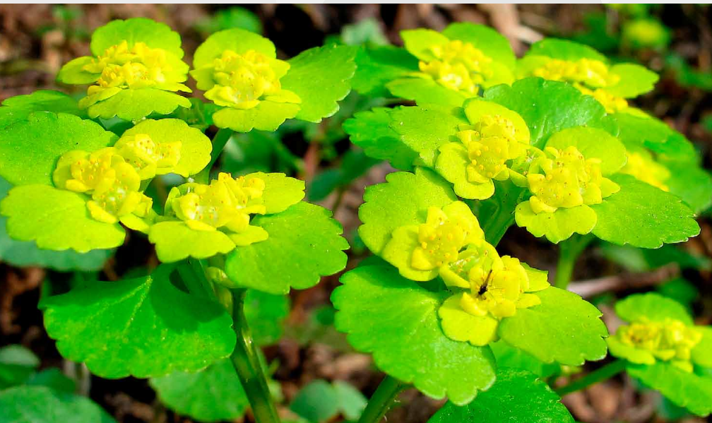
Pamišļapu pakrēsīte ( Chrysosplenium alternifolium )