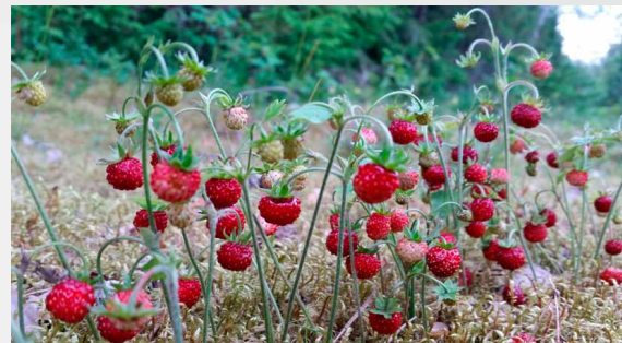
Meža zemenītes ( Fragaria vesca )