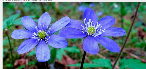
Zilā vizbulīte ( Hepatica nobilis )

i Maršruts Iepazīstina ar augu un biotopu daudzveidību Gaujas senlejas senkrasta posmā starp Krimuldu un Velnaļas klintīm. Piemērots ikvienam, kam ir interese par augiem, sēnēm un arī Gaujas Nacionālajā parkā sastopamajām zvēru un putnu sugām. Augu pilnvērtīgas iepazīšanas nolūkā vēlams zinošs dabas gids.