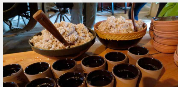
Maltīte Āraišu ezerpilī