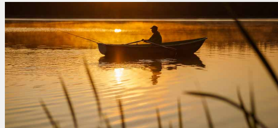
Raiskuma ezers saulrietā