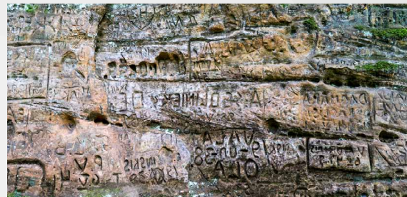
Sarkanās klintis, fragments