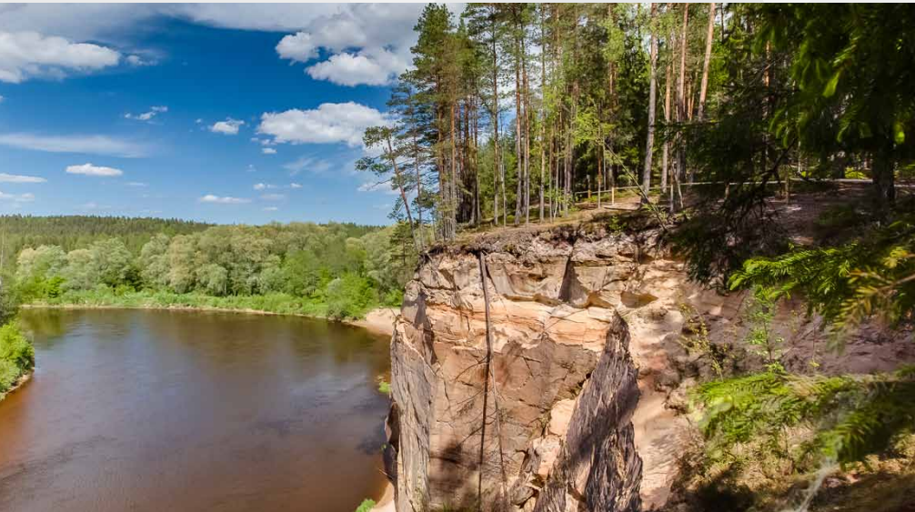
Ērģļu (Ērģļu) klintis