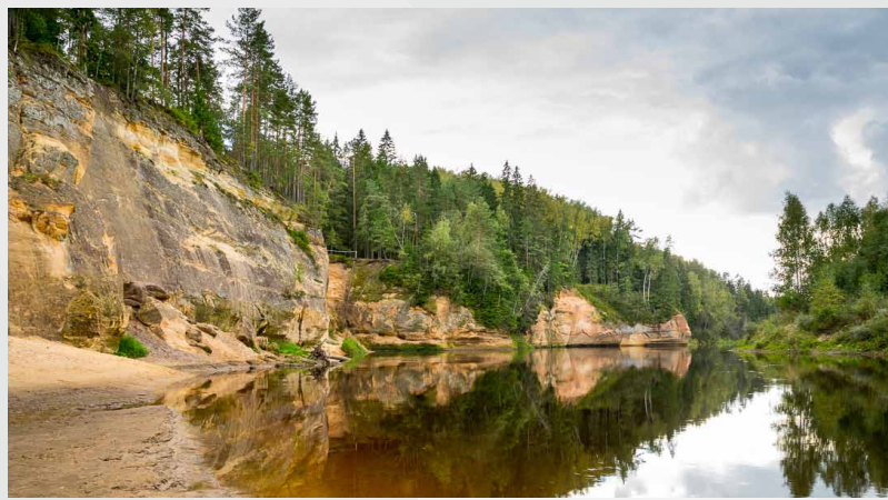
Ērgļu (Ērgēļu) klintis