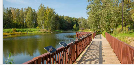
Ģimes dabas taka