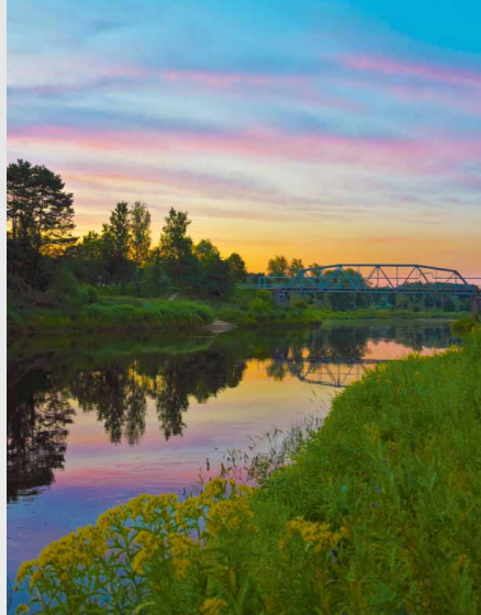
Skats uz Dzelzs tiltu