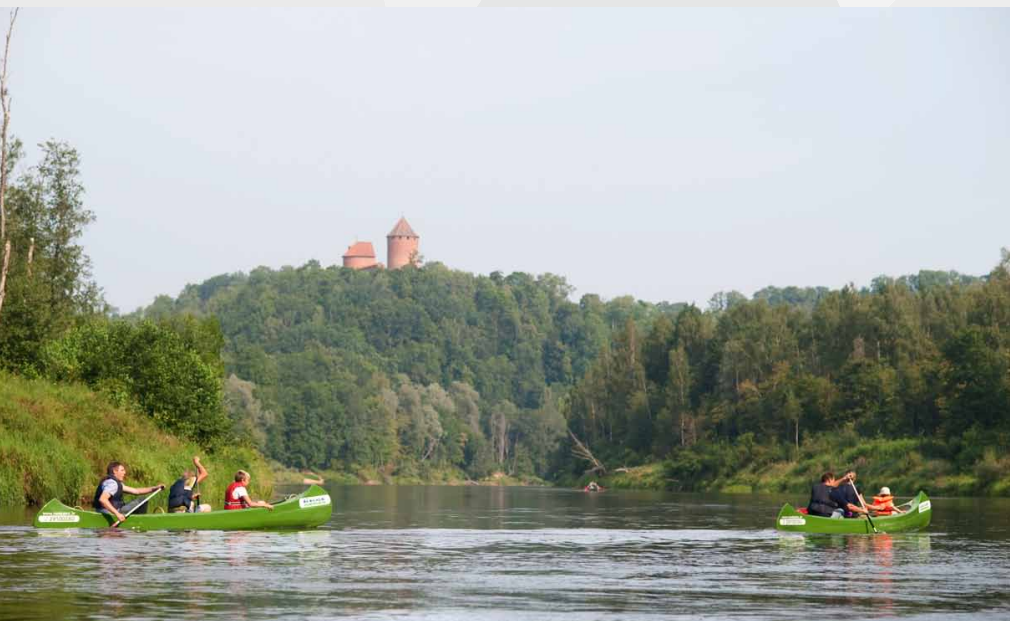
Skats uz Turaidas pili no Gaujas