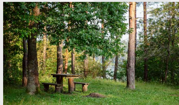
Ūdenstūristu apmetnes vieta

25 | Atpūtas parks "Rāmkalni" 57.12462, 24.65910