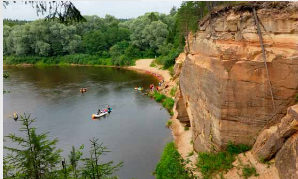
Ergļu (Ergēļu) klintis