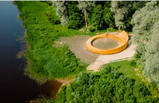
Skatu terase pie Gaujas Valmierā

RĀMKALNI – SIGULDA – LĪGATNE – CĒSIS – VESELAVA – VALMIERA