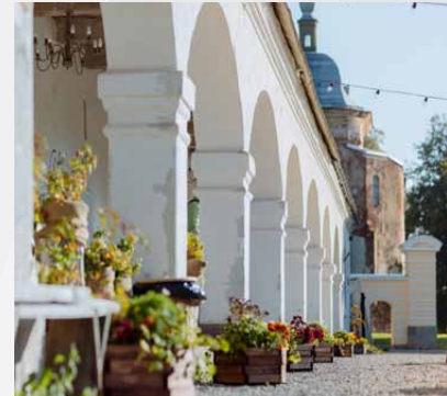
Valmiermuižas klēts un pils tornītis

i Maršruts. Maršruts (starp Gaujas kreiso krastu un A2 autoceļu) šķērso visu Gaujas Nacionālā parka teritoriju dienvidrietumu–ziemeļaustrumu virzienā. Tajā iekļauti izcilākie teritorijas dabas pieminekļi, labākās skatu un ainaviskākās vietas. Lai maršrutu dažādotu, tajā ir atrodami arī nozīmīgākie kultūras un vēstures pieminekļi, kas nereti ir cieši saistīti un neatraujami no dabas vides. Piemēram, Līgatne ir ne tikai papīrfabrikas ciemats, bet arī vieta, kur iedzīvotāji daudzu gadu garumā sadzīves un rūpnieciskām vajadzībām veidojuši alu sistēmas un pagrabus, kas mūsdienās ir interesanti apskates objekti. Livonijas ordeņa Siguldas pils ir cilvēka radīts objekts, taču to celtniecības materiālu – laukakmeņus ir “atnesis” ledājs no Skandināvijas.