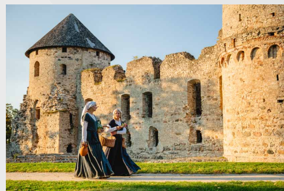
Cēsu Viduslaiku pils

16 | Cēsu Viduslaiku pils 17 | Cēsu Jaunā pils