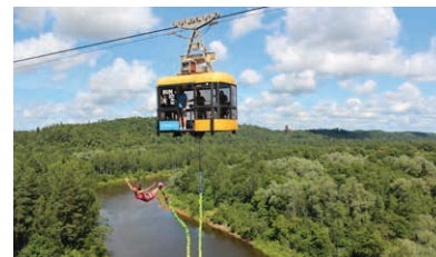
8 Siguldas gaisa trošu ceļš – vagoniņš

Siguldas vagoniņš piedāvā braucienu pār Gaujas senieleju, skatam pavērot burvīgu ainavu vairāku kilometru tālumā, iekļaujot Siguldas un Turaidas pili, Krimuldas muizī, kā arī bobsleja un kamanīņu trasī "Sigulda".