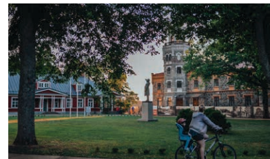
11 Siguldas Jaunā pils un Siguldas pils kvartāls

Siguldas tauriņu māja – vieta, kur var izziņāt tauriņu māža ceļojumu, kas dažkārt var būt tikpat raibs kā tā spārni, uzzināt vairāk par tauriņu uzbūvi, dzīves ciklu, uzvedību un daudz ko citu. Tauriņu māja atveras līdz ar pirmo tauriņu šķīšanās. Adrese: Pie Siguldas Svētķu laukuma, Lāčplēša iela 9A, Sigulda.