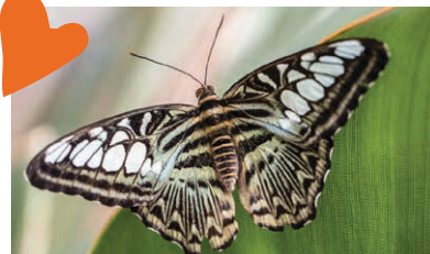
5 Tropu tauriņu māja

Adrese: krustojumā starp Cēsu un J. Poruka ielām.