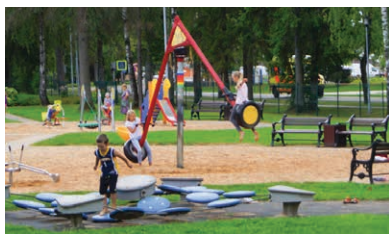
2 Raiņa parks

Bērnu izklaides centrs, kur pieejama atrakcija ar šķēršļu joslu, slīdkalniņiem, bumbu baseinu, šūpolēm, labirintu, batutiem; "Xbox" spēļu un deju grīda, galda futbols un atsevišķi norobežots spēļu laukums. Jaunajām māmiņām iekārtota komfortabla barošanas un bērniņa apkopšanas telpa ar nepieciešamajām higiēnas precēm mammai un bērnam. Adrese: Pulkveža Briēža iela 111C, Sigulda.