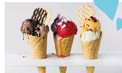
11 Siguldas saldējums

Adrese: Krišjāņa Valdemāra iela 2, Sigulda.