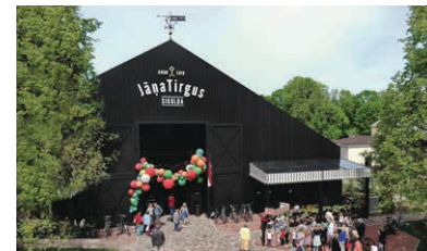
16 Jāņa Tirgus

Jāņa Tirgū zem viena jumta atrodas vietējie Latvijas tirgotāji un ēdinātāji. Šeit nodrošināts plašs svaigais gaļas, zivju, maizes, augļu, ogu un dārzeņu klāsts. Tāpat Jāņa Tirgū ir ierīkots bezmaksas dzeramā ūdens uzpildes punkts, ir pieejams bērnu pārtikas galdiņš.