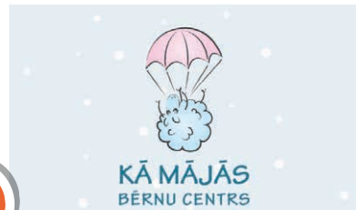
Bērnu centrs "Kā mājās"

Baznīcā regulāri notiek dievkalpojumi, kā arī citi pasākumi, kas domāti ne tikai draudzei, bet arī pilsētai un tās viesiem. Labās akustikas dēļ dievnamā labprāt uzstājas dažādu stilu mūziķi. Pieejams lifts, kā arī bērnu pārtikas galdiņš. Adrese: Raunas iela 8, Sigulda.