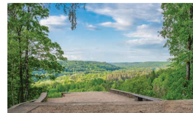
13 Paradīzes kalns

Paradīzes kalns ir viena no skaistākajām skatu vietām Siguldā. No šejienes pavērs gleznains skats uz Gaujas senieleju – līdz pat 12 kilometriem. Siguldas Paradīzes kalna pakājē šalc Vējupīte. Šeit var atpūties, baudīt putnu dziesmas un skaisto panorāmu. Koordinātas: 57.174757, 24.865504.