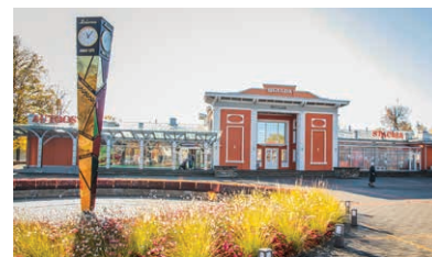
15 Stacijas laukums un Laimas pulkstenis

Sigulda ieguva Mīlesības pilsētas titulu un arī unikālu iespēju izveidot satikšanās vietu, kuras centrā ir pulkstenis. Vietējā strūklaka ir iecienīta vieta bērnu izklaidēm. Siguldas dzelzceļa stacija ir arī pieejams bērnu pārtikas galdiņš.