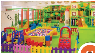
14 Bērnu izklaides centrs "Brīnumu mežs"

Bērnu izklaides centrs, kur pieejama atrakcija ar šķēršļu joslu, slīdkalniņiem, bumbu baseinu, šūpolēm, labirintu, batutiem; "Xbox" spēļu un deju grīda, galda futbols un atsevišķi norobežots spēļu laukums. Jaunajām māmiņām iekārtota komfortabla barošanas un bērniņa apkopšanas telpa ar nepieciešamajām higiēnas precēm mammai un bērnam. Adrese: Pulkveža Briēža iela 111C, Sigulda.