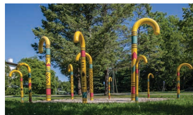
9 Spieķu parks

Adrese: Leona Paegles iela 3A-53A, Sigulda.