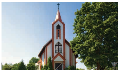
17 Siguldas Romas katoļu baznīca

Raiņa parks ir lielākā atpūtas vieta bērniem un jauniešiem Siguldā. Parks ir sadalīts rotāju laukumos pa vecuma grupām: 1-3 gadus, 4-6 gadus un 7-12 gadus veciem bērniem. Parkā ir ierīkots arī basketbola laukums un skeitparks vecākiem jauniešiem. Blakus parkam atrodas K/C "Siguldas devons" ar pieejamu pārtikas galdu mazuļiem, kā arī iespēja apskatīt dažādas mākslinieku izstādes un ekspozīcijas. Adrese: Raiņa iela 2, Sigulda.