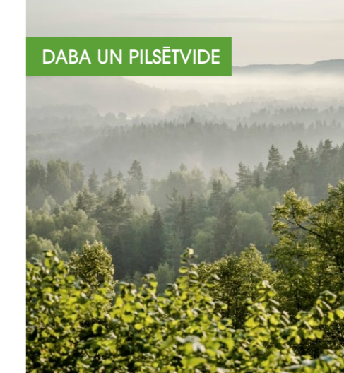
DABA UN PILSĒTVIDE