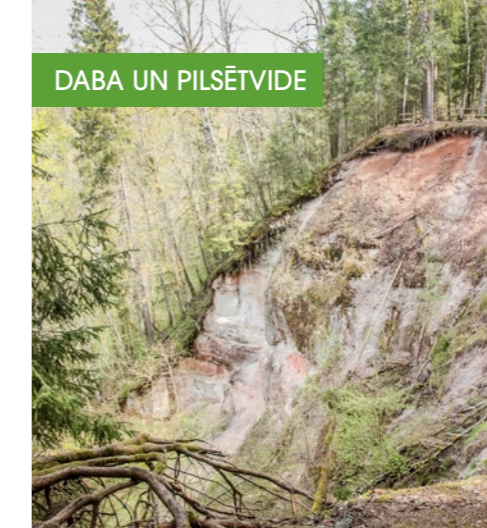
DABA UN PILSĒTVIDE