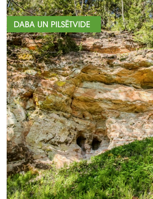
DABA UN PILSĒTVIDE