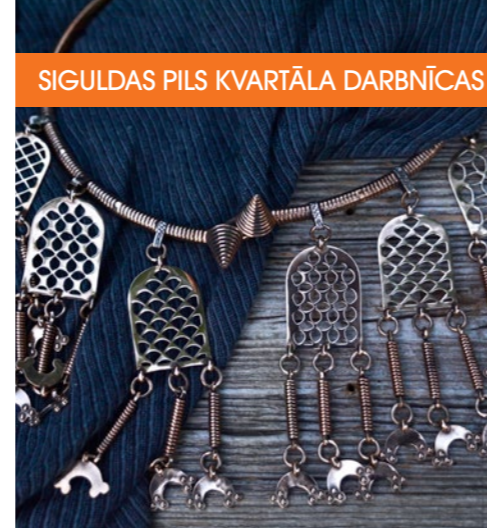
SIGULDAS PILS KVARTĀLA DARBNĪČAS