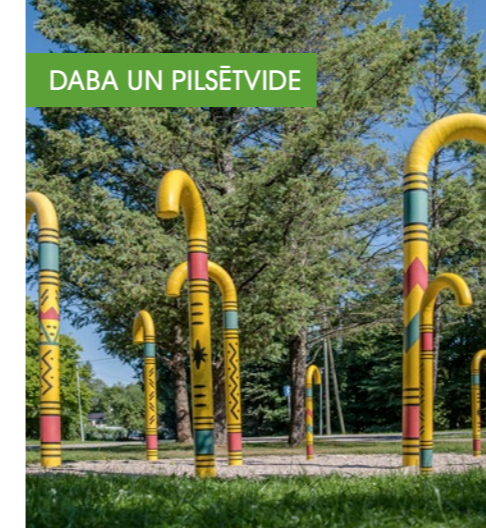
DABA UN PILSĒTVIDE