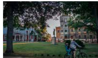
Siguldas Jaunā pils un Siguldas pils kvartāls

Siguldas Jaunā pils jau no 1937. gada ir dēvēta kā nacionālā romantisma perle. Mūsdienās pils kvartālā ēkā darbojas amatnieki un mākslinieki, kuru darbnīcās un salonos iespējams gan apgūt jaunus prasmes, gan iegādāties suvenīrus, nogaršot Siguldas izcilo saldējumu, vai vienkārši izbaudīt esošo apkārtni no skatu platformām.