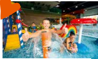
Siguldas Sporta centrs

Ģimenes ar bērniem iepriecinās Ūdens atrakciju parks. Parkā ir pieejams bērnu ūdens atrakciju baseins ar slidkalniņiem un ūdenskritumu, kuru iecienījuši vecāki ar mazākajiem bērniem, kā arī ūdens slidreņus un kaskādes.