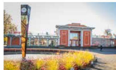
Stacijas laukums un Laimas pulkstenis

Adrese: Krišjāņa Valdemāra iela 2, Sigulda.