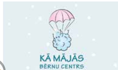
Bērnu centrs "Kā mājās"

Bērnu izklaides centrs, kur pieejama atrakcija ar šķēršļu joslu, slidkalniņiem, bumbu baseinu, šūpolēm, labirintu, batutiem; Xbox spēļu un deju grīda, galda futbols un atsevišķi norobežots spēļu laukums. Jaunajām māmiņām iekārtota komfortabla barošanas un bērniņa apkopšanas telpa ar nepieciešamajām higiēnas precēm mammai un bērnam. Adrese: Pulkveža Briēža iela 111c, Sigulda.