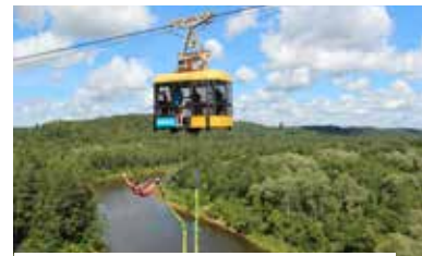
Siguldas gaisa trošu ceļš - vagoniņš

Siguldas vagoniņš piedāvā braucienu pār Gaujas senleju, skatam paverot burvīgu ainavu vairāku kilometru tālumā, iekļaujot Siguldas un Turaidas pili, Krimuldas muizli, kā arī Bobsleja un kamanīņu trasī "Sigulda".