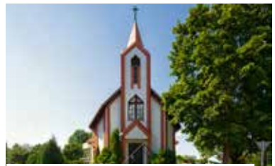
Siguldas Romas katoļu baznīca

Adrese: krustojumā starp Cēsu un J. Poruka ielām.